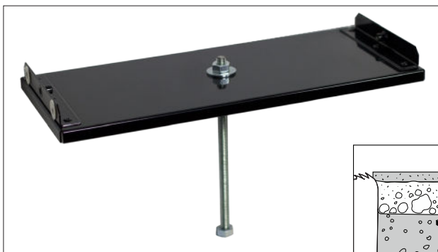
Bodenplatte mit Bodenbefestigung

Betonieren Sie die mitgelieferte Bodenbefestigung ein und befestigen Sie dann die Bodenplatte mit der Mutter.